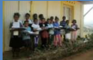
kits scolaires aux 6ème