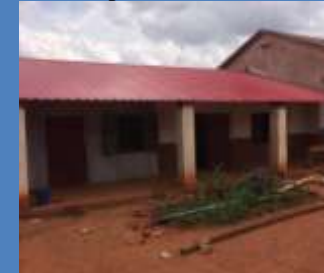
nouvelle toiture CEG