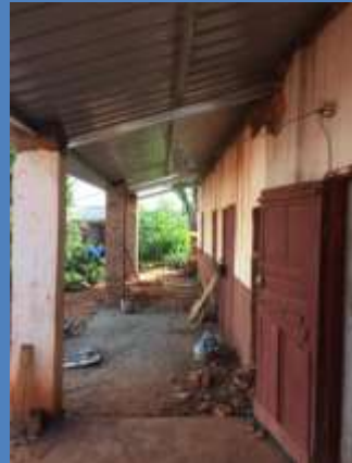
Avancée préau salles 11-12