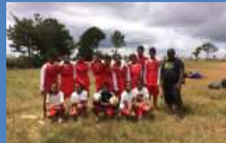
maillots et ballon ES Louzy