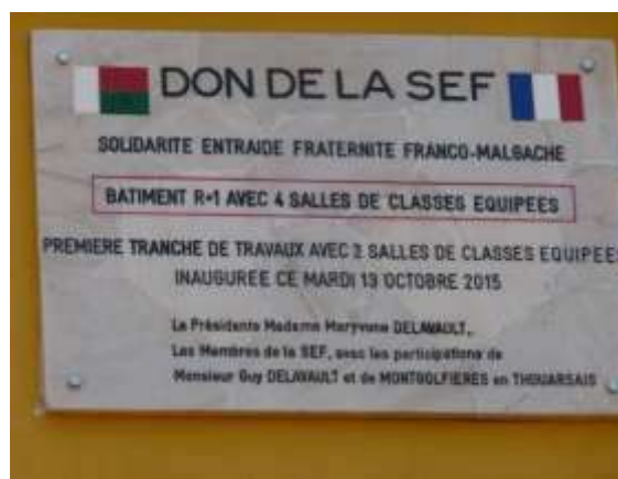
Le nouveau bâtiment (1 ère phase) et sa plaque commémorative