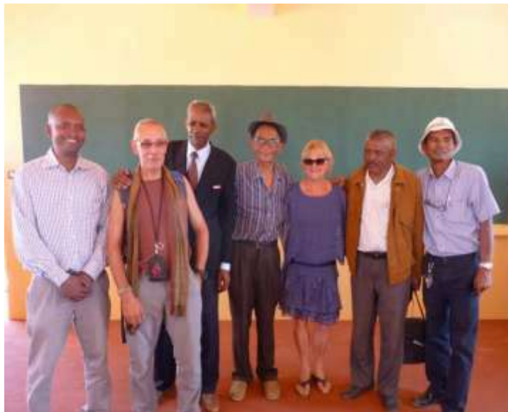
L'équipe porteuse du projet